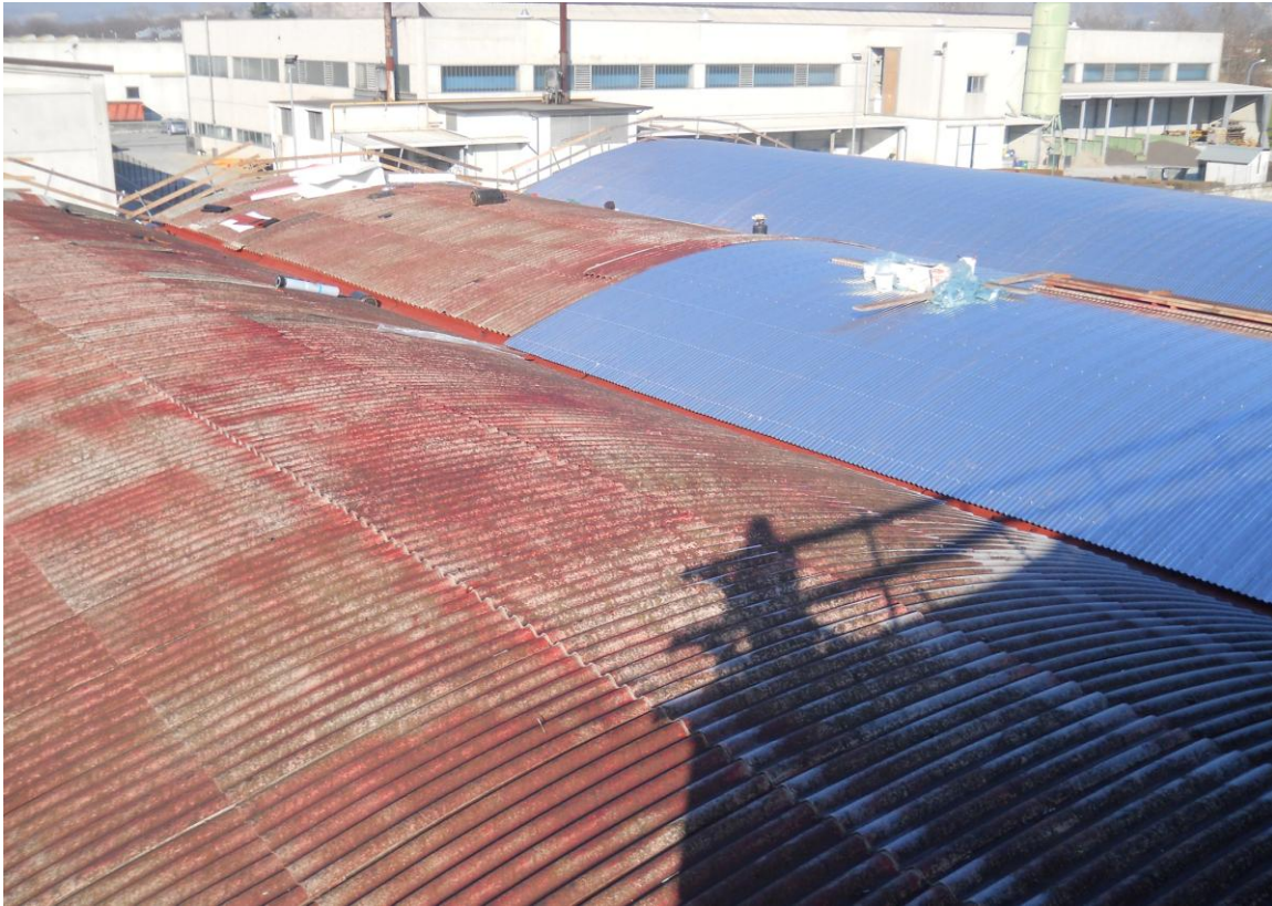
SMALTIMENTO AMIANTO E RIFACIMENTO COPERTURE