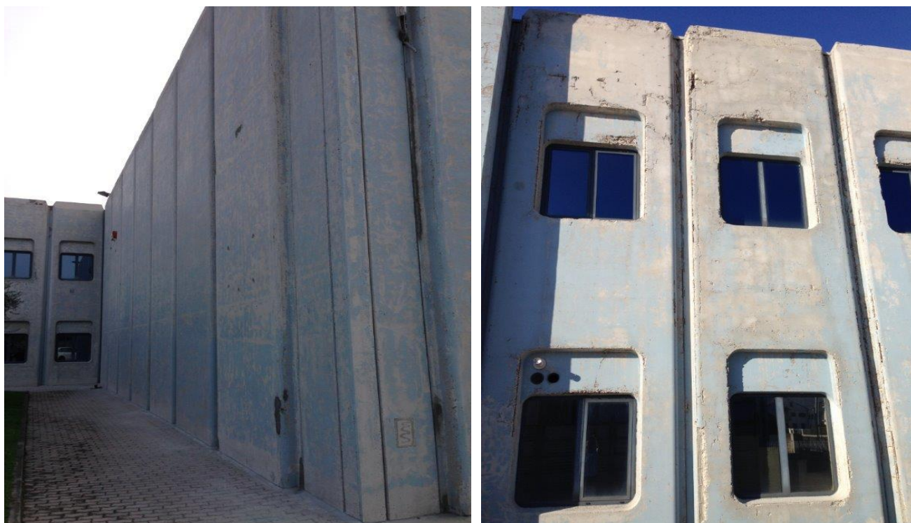
RIPRISTINO FACCIATE AMMALORATE DI PANNELLI PREFABBRICATI