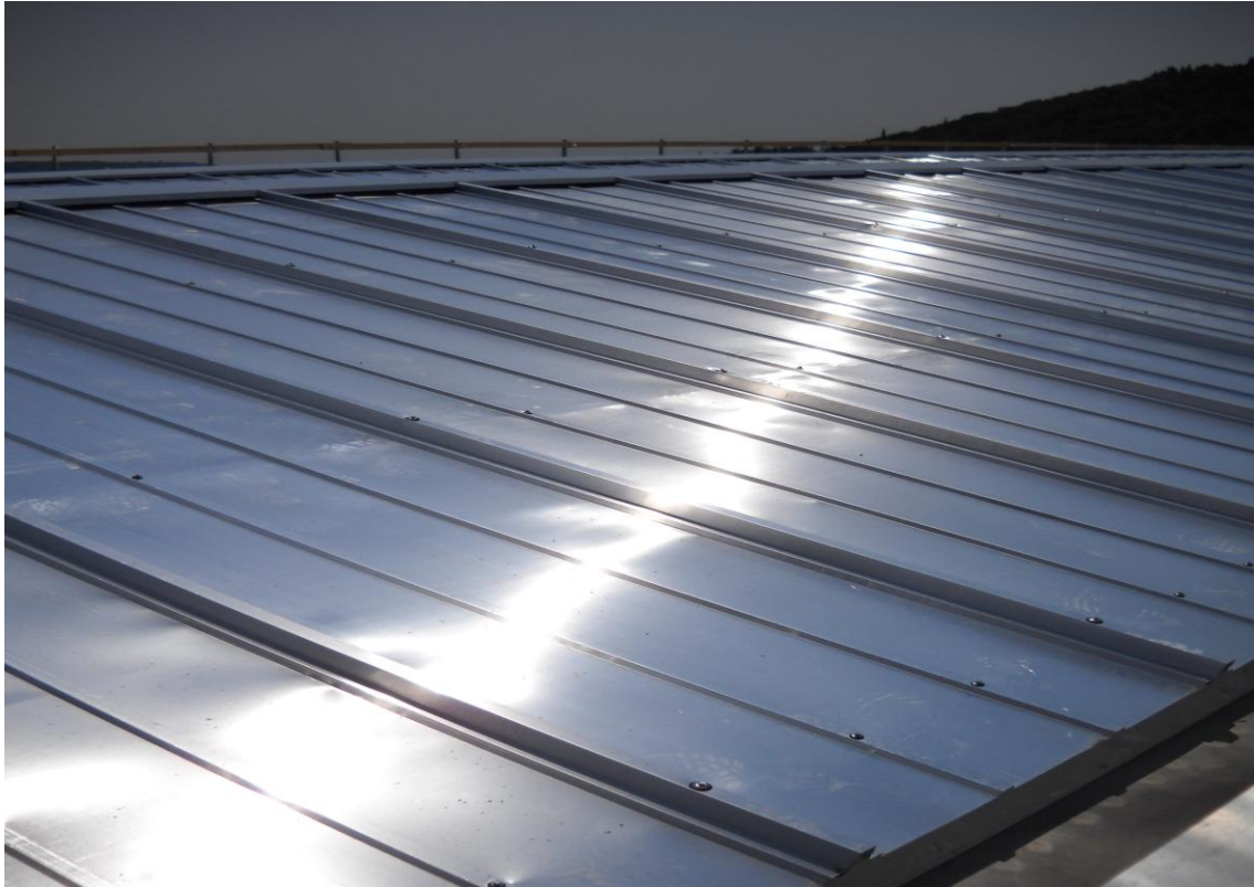
COPERTURE INDUSTRIALI IN LAMIERE METALLICHE