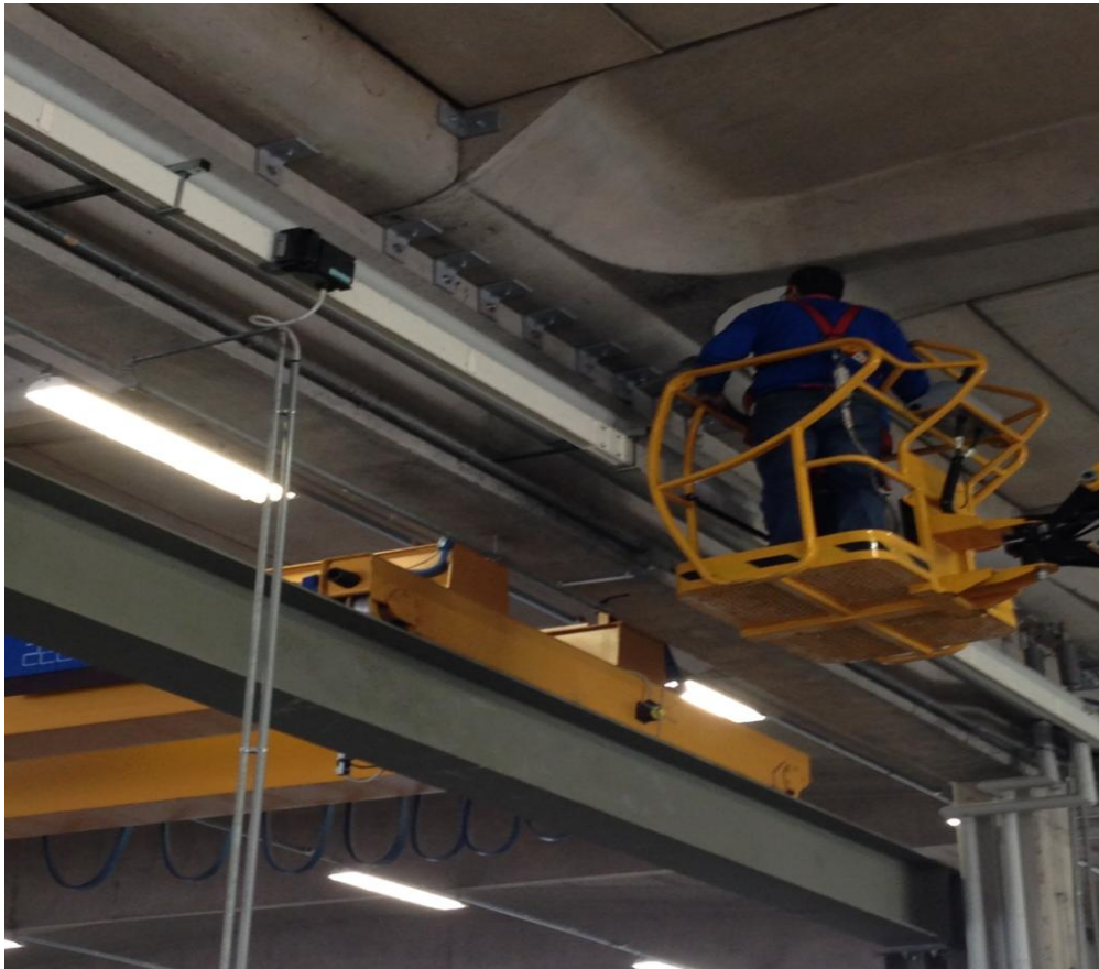
OPERE DI INCREMENTO DELLA CAPACITA' DI RESISTERE ALLE SOLLECITAZIONI SISMICHE